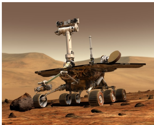
Abbildung 2.1: Mars Rover der NASA

Natürlich können auch Grafiken und Bilder eingebunden werden, siehe z. B. Abbildung 2.1. Beschriften Sie Bilder und Tabellen mit der Funktion „Beschriftung einfügen“ zu der Sie über das Kontextmenü gelangen.